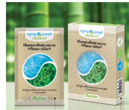
Саше 10 мл | Арт.: 60144 Бокс – 5 саше | Арт.: 60151

ГИДРОЛИЗАТ КОЛЛАГЕНА, ГИАЛУРОНОВАЯ КИСЛОТА, МЕНТОЛ РАЦЕМИЧЕСКИЙ, АЛЛАНТОИН, ЭКСТРАКТЫ ЛИПЫ, МЯТЫ, РОМАШКИ, ЭФИРНЫЕ МАСЛА АПЕЛЬСИНА, ЛИМОНА