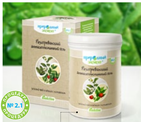
Банка 250 мл | Арт.: 60434

КОСТОЧКА ОЛИВЫ, ГИДРОЛИЗАТ КОЛЛАГЕНА, ЭКСТРАКТЫ ВАКАМЕ, ПЛАНКТОНА, ЛАМИНАРИИ, ГИНКГО, ЭФИРНЫЕ МАСЛА АПЕЛЬСИНА, ИЛАНГ-ИЛАНГА, ЛИМОНА, ШАЛФЕЯ, ПАЧУЛИ