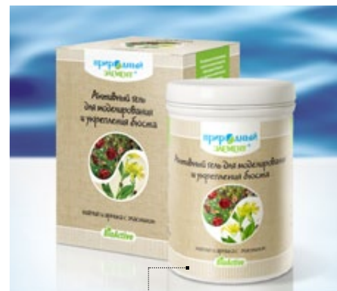
Банка 250 мл | Арт.: 60465

ГИДРОЛИЗАТ КОЛЛАГЕНА, ЭКСТРАКТЫ ПЛЮЩА, КИПАРИСА, ФУКУСА, ЛАМИНАРИИ, ИГЛИЦЫ, МОЖЖЕВЕЛЬНИКА, ИМБИРЯ, ГИНКГО, КОЛЫ, ЗЕЛЕНОГО ЧАЯ, ЭФИРНЫЕ МАСЛА ГРЕЙПФРУТА, ЛИМОНА, МОЖЖЕВЕЛЬНИКА