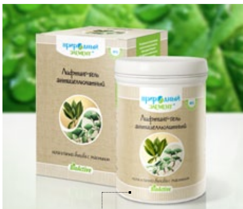
Банка 250 мл | Арт.: 60441