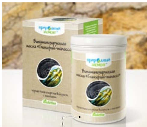
Банка 330 гр | Арт.: 60496

ГЛИНА БЕЛАЯ, БИШОФИТ, СЕРЕБРОСОДЕРЖАЩИЙ РАСТВОР, ЭФИРНОЕ МАСЛО ПИХТЫ