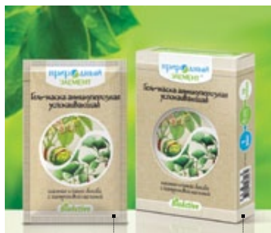
Саше 10 мл | Арт.: 60267 | Бокс – 5 саше | Арт.: 60274

ГИАЛУРОНОВАЯ КИСЛОТА, БИОПРОТЕКТИЛ, А-СТРЕССИЛ (БЕЛАЯ ИВА), ЭФИРНОЕ МАСЛО НЕРОЛИ