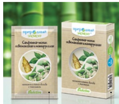
Саше 10 мл | Арт.: 60328 Бокс – 5 саше | Арт.: 60335

ЛИМОННАЯ КИСЛОТА, ЯБЛОЧНАЯ КИСЛОТА, ГИАЛУРОНОВАЯ КИСЛОТА, ЭКСТРАКТ ПАПАЙИ, ПАНТЕНОЛ, OLIVEM 300 (ЭФИР ОЛИВКОВОГО МАСЛА)