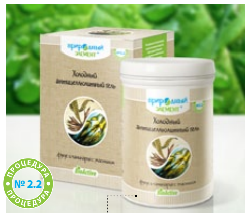
Банка 250 мл | Арт.: 60427

ГИДРОЛИЗАТ КОЛЛАГЕНА, L-КАРНИТИН, ПАНТЕНОЛ, ЭКСТРАКТЫ ЗЕЛЕННОГО ЧАЯ, ИГЛИЦЫ, ИМБИРЯ, ЧЕРНОГО ПЕРЦА, КОЛЫ, ФУКУСА, МОЖЖЕВЬЕЛЬНИКА, ЛАМИНАРИИ, ЦЕНТЕЛЛЫ АЗИАТСКОЙ, ГИНКГО, ЭФИРНЫЕ МАСЛА КИПАРИСА, КОРИЦЫ, ИМБИРЯ, НЕРОЛИ, ПЕРЦА, РОЗМАРИНА, МУСКАТНОГО ОРЕХА, МОЖЖЕВЬЕЛЬНИКА, ЭВКАЛИПТА