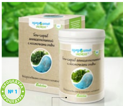
Банка 250 мл | Арт.: 60038