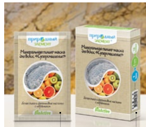
Саше 10 мл | Арт.: 60403 | Бокс – 5 саше | Арт.: 60410