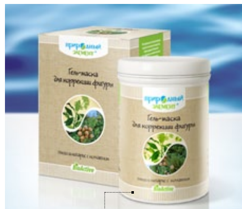
Банка 250 мл | Арт.: 60458

ГИАЛУРОНОВАЯ КИСЛОТА, ГИДРОЛИЗАТ ЭЛАСТИНА, ЭКСТРАКТЫ КОЛЫ, ЦЕНТЕЛЛЫ АЗИАТСКОЙ, ГИНКГО БИЛОБА, АЛОЭ, ЭФИРНЫЕ МАСЛА НЕРОЛИ, ЛЕМОНГРАССА, ЛИМОНА, АПЕЛЬСИНА, ТУИ, ГРЕЙПФРУТА