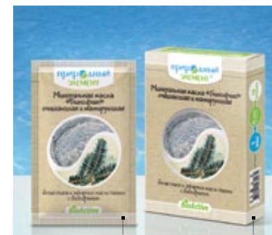
Саше 10 мл | Арт.: 60069 | Бокс – 5 саше | Арт.: 60076

ГИДРОЛИЗАТ ЭЛАСТИНА, ГИАЛУРОНОВАЯ КИСЛОТА, КАМФОРА РАЦЕМИЧЕСКАЯ, ЭКСТРАКТ ГАМАМЕЛИСА, ЭФИРНЫЕ МАСЛА ГРЕЙПФРУТА, ИЛАНГ-ИЛАНГА, ЛИМОНА, МОЖЖЕВЕЛЬНИКА