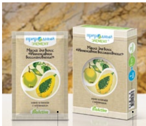
Саше 10 мл | Арт.: 60342 | Бокс – 5 саше | Арт.: 60359