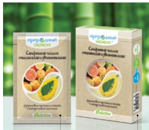
Саше 10 мл | Арт.: 60304 Бокс – 5 саше | Арт.: 60311

ГЛИКОЛЕВАЯ КИСЛОТА, ГИДРОЛИЗАТ КОЛЛАГЕНА, ЭКСТРАКТЫ ОГУРЦА, ФУКУСА, ЭФИРНЫЕ МАСЛА ИЛАНГ-ИЛАНГА, МОЖЖЕВЬЛЬНИКА, ЧАЙНОГО ДЕРЕВА