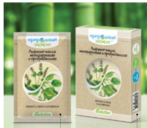
Саше 10 мл | Арт.: 60205 Бокс – 5 саше | Арт.: 60212

ГЛИНА КРАСНАЯ, БИШОФИТ, СЕРЕБРОСОДЕРЖАЩИЙ РАСТВОР ГИДРОЛИЗАТ ЭЛАСТИНА, ЭКСТРАКТЫ КОНСКОГО КАШТАНА, ПРОРОСТКОВ ПШЕНИЦЫ, АЛОЭ, ВИТАМИН Е, ВИТАМИН F, ЭФИРНОЕ МАСЛО ЛИМОНА