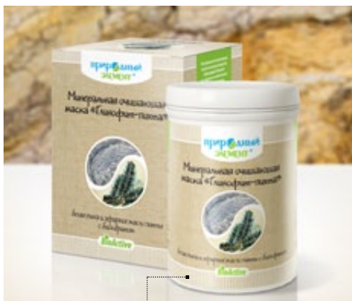
Банка 330 гр | Арт.: 60489