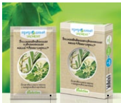
Саше 10 мл | Арт.: 60243 | Бокс – 5 саше | Арт.: 60250