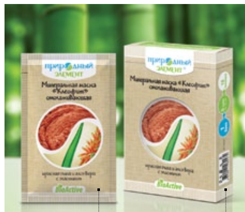
Саше 10 мл | Арт.: 60120 Бокс – 5 саше | Арт.: 60137

ГИДРОЛИЗАТ ЭЛАСТИНА, ГИАЛУРОНОВАЯ КИСЛОТА, БИСАБОЛОЛ, ЭКСТРАКТЫ БУЗИНЫ, МАЛЬВЫ, ПЛЮЩА, ОГУРЦА, ВИНОГРАДНЫХ ЛИСТЕВ, АРНИКИ, ЭФИРНЫЕ МАСЛА АПЕЛЬСИНА, НЕРОЛИ, ПЛАЧУЛИ