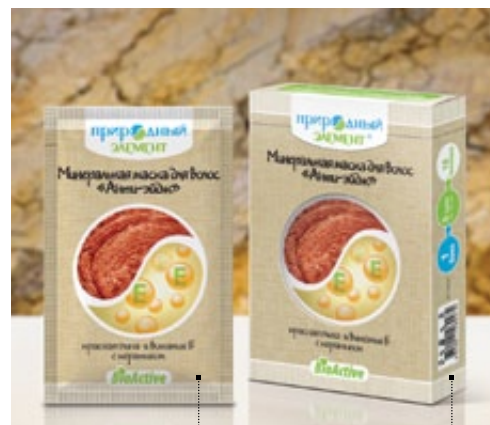
Саше 10 мл | Арт.: 60366 | Бокс – 5 саше | Арт.: 60373