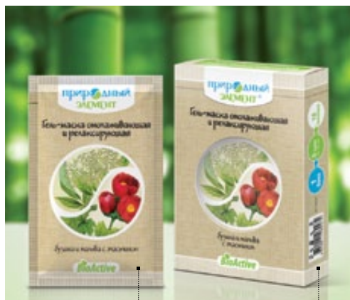
Саше 10 мл | Арт.: 60083 Бокс – 5 саше | Арт.: 60090

Омоложение, лифтинг и увлажнение. Маски для кожи лица и зоны декольте Для любой кожи лица