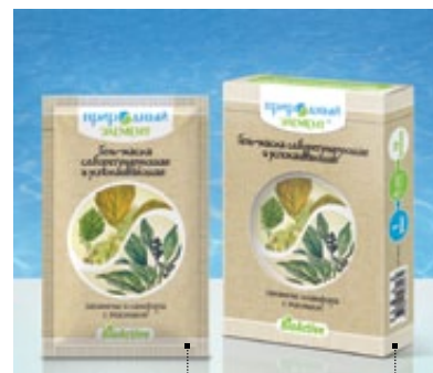
Саше 10 мл | Арт.: 60045 | Бокс – 5 саше | Арт.: 60052

ГИАЛУРОНОВАЯ КИСЛОТА, ГИДРОЛИЗАТ КОЛЛАГЕНА, БИСАБОЛОЛ, ЭФИРНЫЕ МАСЛА ГВОЗДИКИ, РОЗМАРИНА, ЧАЙНОГО ДЕРЕВА