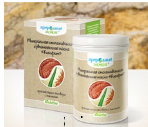
Банка 330 гр | Арт.: 60502

ГЛИНА ЧЕРНАЯ, БИШОФИТ, СЕРЕБРОСОДЕРЖАЩИЙ РАСТВОР, ЭКСТРАКТ ЛАМИНАРИИ, ГИДРОЛИЗАТ ЭЛАСТИНА, ЭФИРНОЕ МАСЛО ЛИМОНА