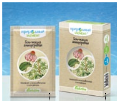
Саше 10 мл | Арт.: 60014 | Бокс – 5 саше | Арт.: 60021

ГИАЛУРОНОВАЯ КИСЛОТА, ЭКСТРАКТЫ ФУКУСА, ЛАМИНАРИИ, КОНСКОГО КАШТАНА, ВИНОГРАДА, ГИНКГО, ЭФИРНЫЕ МАСЛА ГЕРАНИ, КИПАРИСА, РОЗЫ, РОМАШКИ