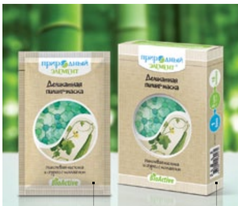
Саше 10 мл | Арт.: 60281 Бокс – 5 саше | Арт.: 60298