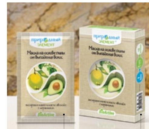
Саше 10 мл | Арт.: 60380 | Бокс – 5 саше | Арт.: 60397