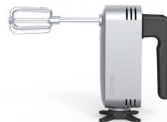
МИКСЕР 3 в 1