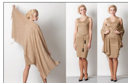
Мод. 59189 Мод. 49184 Мод. 69185