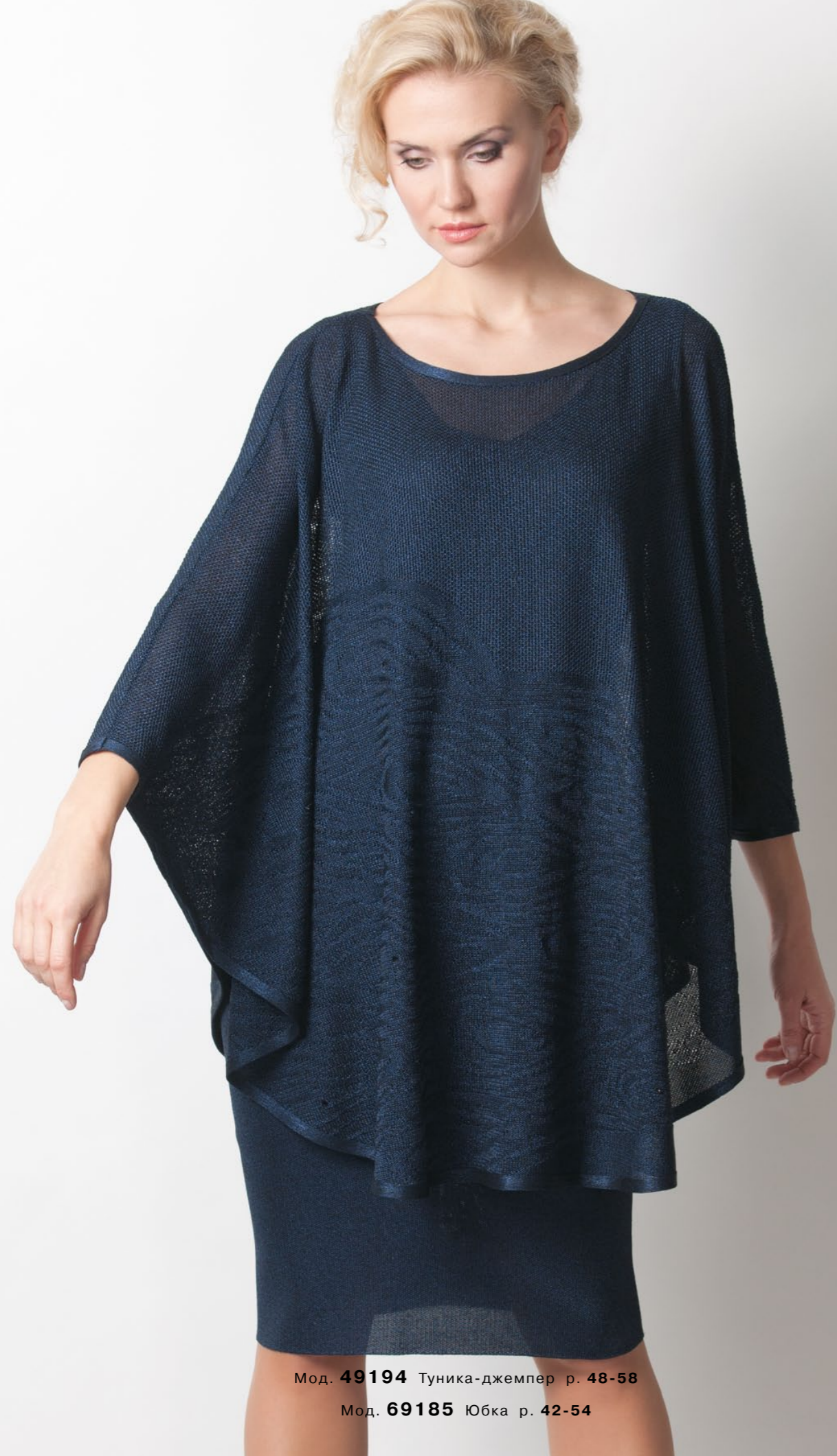
Мод. 49194 Туника-джерпер р. 48-58