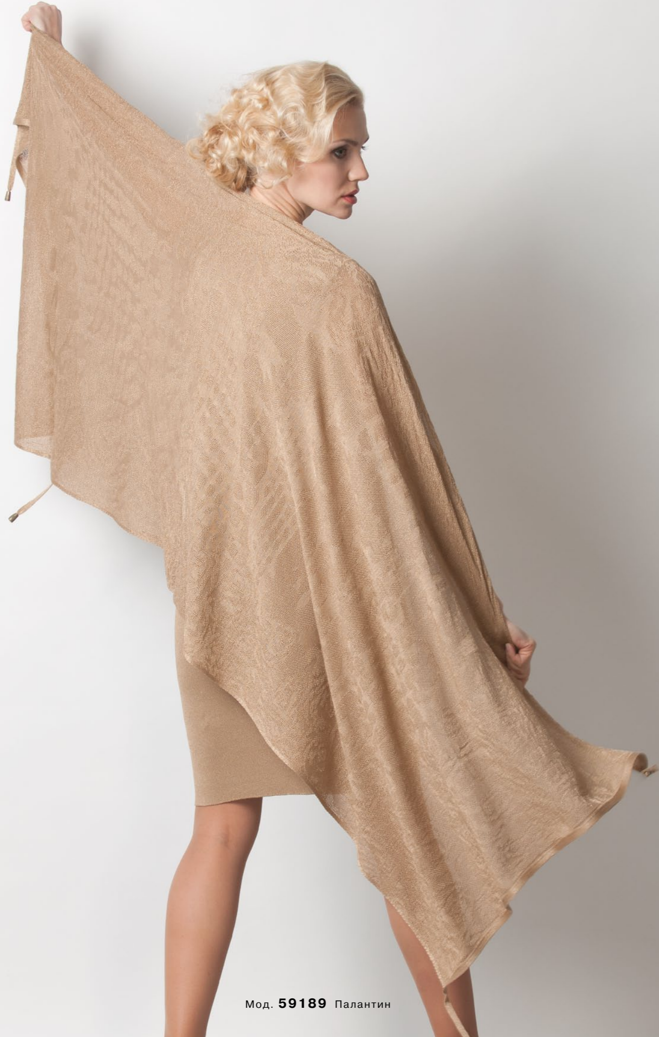
Мод. 59189 Палантин