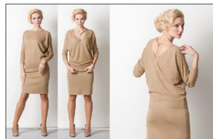
Мод. 49195 Мод. 69185