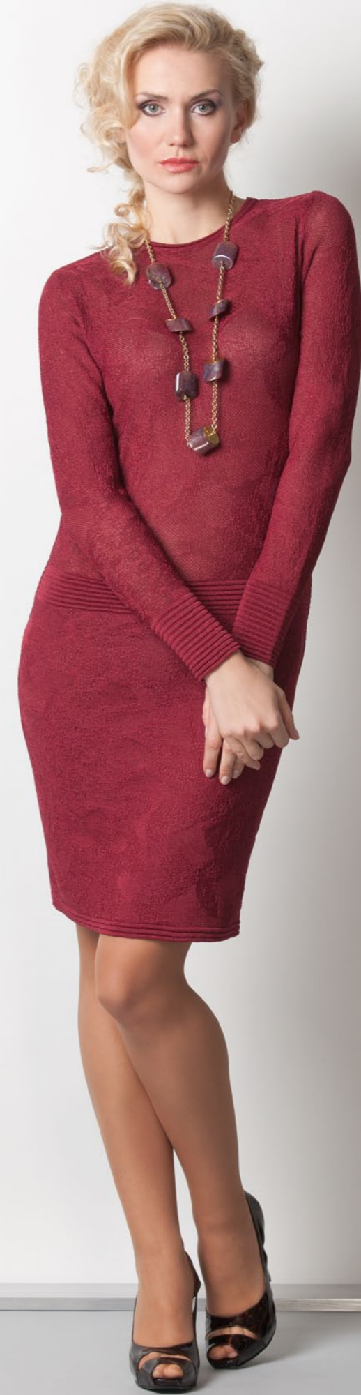
Мод. 39187 Платье р. 42-52