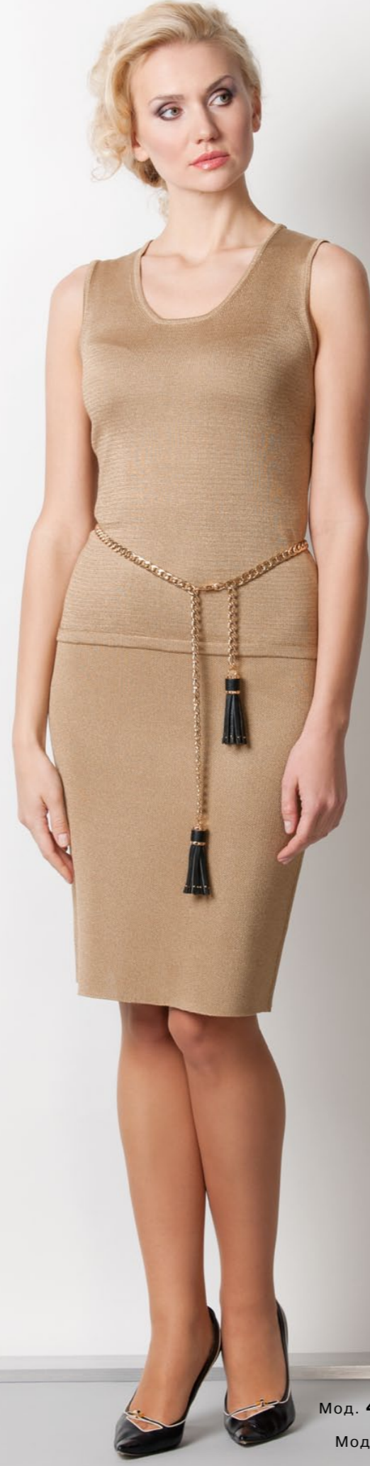
Мод. 49184 Джемпер р. 42-54