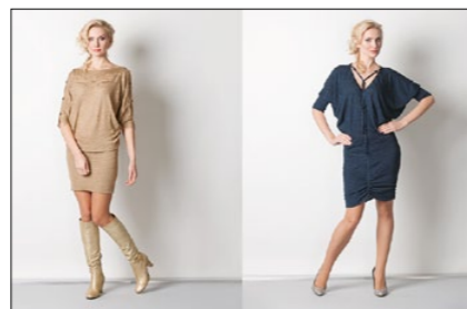
Мод. 39186 Мод. 39193