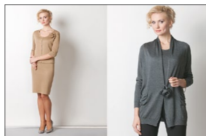
Мод. 59192 Мод. 69185