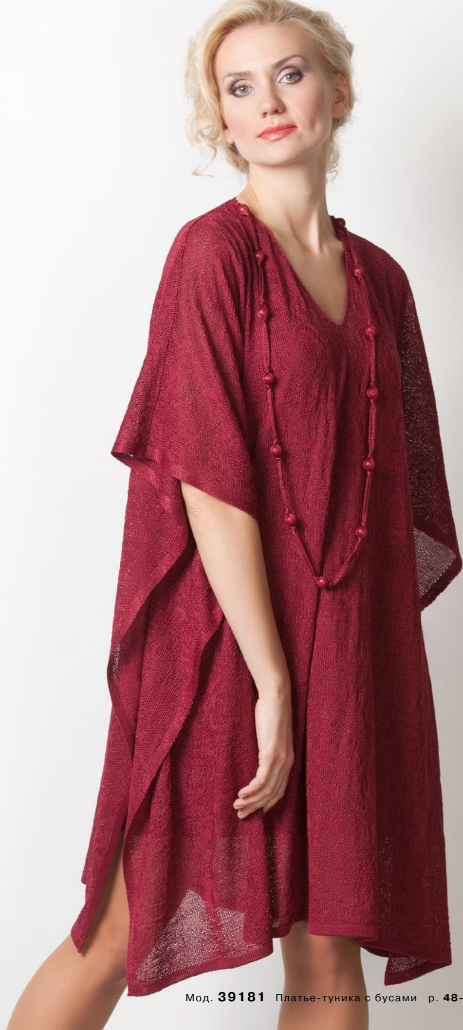
Мод. 39181 Платье-туника с бусами р. 48-56