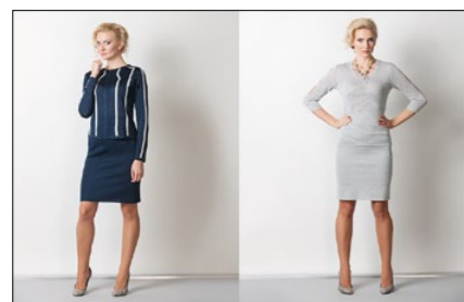
Мод. 59191 Мод. 69185