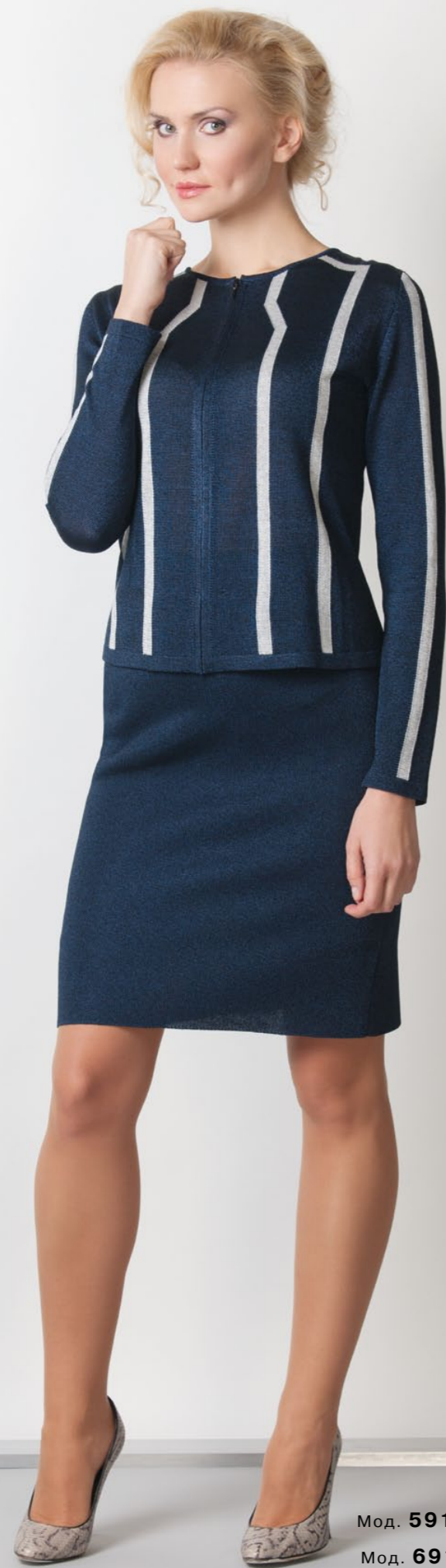
Мод. 59191 Жакет р. 42-52 Мод. 69185 Юбка р. 42-54