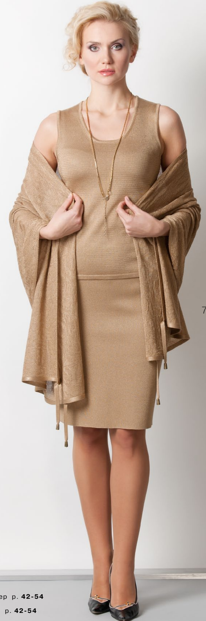
Мод. 69185 Юбка р. 42-54