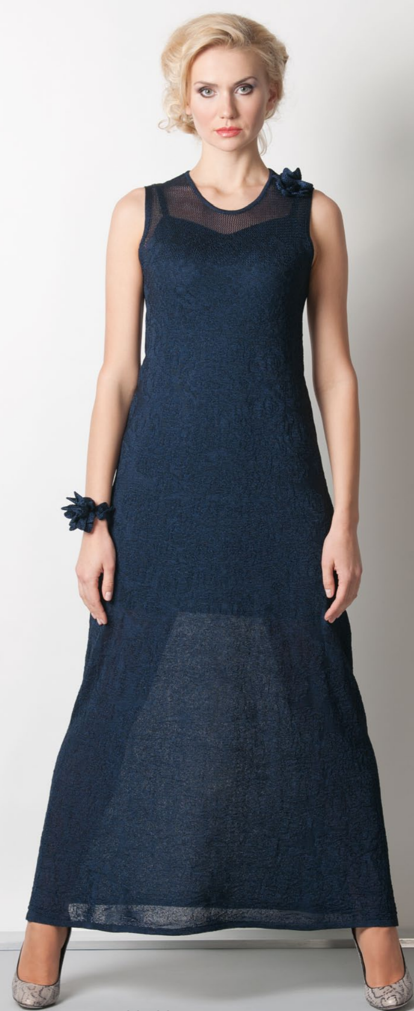
Мод. 39188 Платье с розами р. 42-50