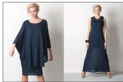
Мод. 49194 Мод. 69185