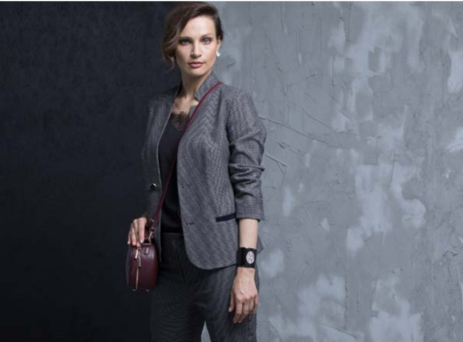
FALL -WINTER 2018/19